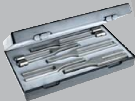
Nr. 5141 Набор II 5 камертонов, изготовленных из стали (Nr. 5161, 5164, Nr. 5166, Nr. 5168, Nr. 5170) в пластиковом футляре.