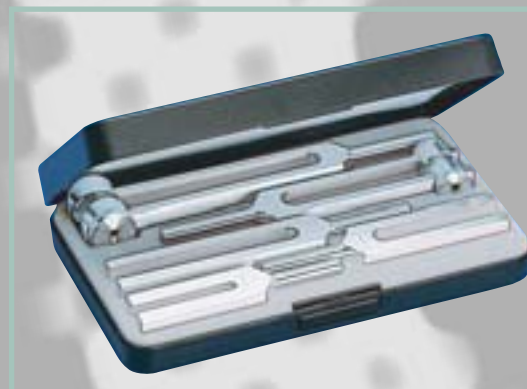
Nr. 5142 Набор III 5 камертонов, изготовленных из алюминия (Nr. 5162, Nr. 5165, Nr. 5167, 5169, Nr. 5171) в пластиковом футляре.